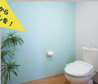
【トイレ壁の施工例】

* 最短1日で施工が可能。色で遊ぶのも楽しい! ※トイレの面積、仕様で施工日数が異なります