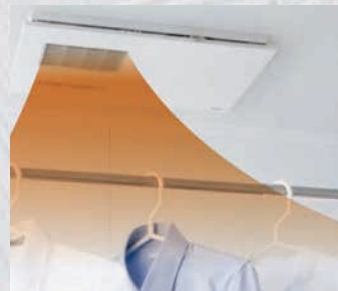
【浴室換気乾燥暖房機】

寝室や居間と温度差がある冬には、ヒートショックのリスクが高まります。 最も急激な温度差が生じやすいのが「トイレ」と「浴室」です。リスクを抑えるために、 屋内の温度をすべて均一にすることが重要です。 その方法として弊社が提案する「塗る断熱」や「浴室換気乾燥暖房機」の設置をおすすめします。